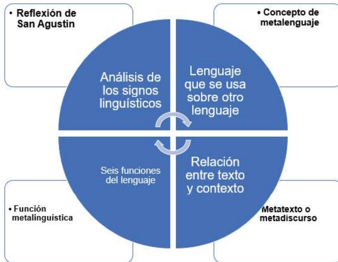
Figura 1. Hitos relevantes en la historia de la metalingüística.