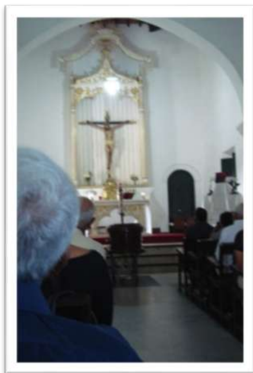
Gráfico 9. Misa de cuerpo presente y bendición del difunto.

El ataúd es ubicado en frente del altar y los familiares se sitúan en los primeros bancos, amigos y vecinos, cercanos al difunto, toman asiento, o se ubican de pie dentro y fuera del templo (gráfico. 9).