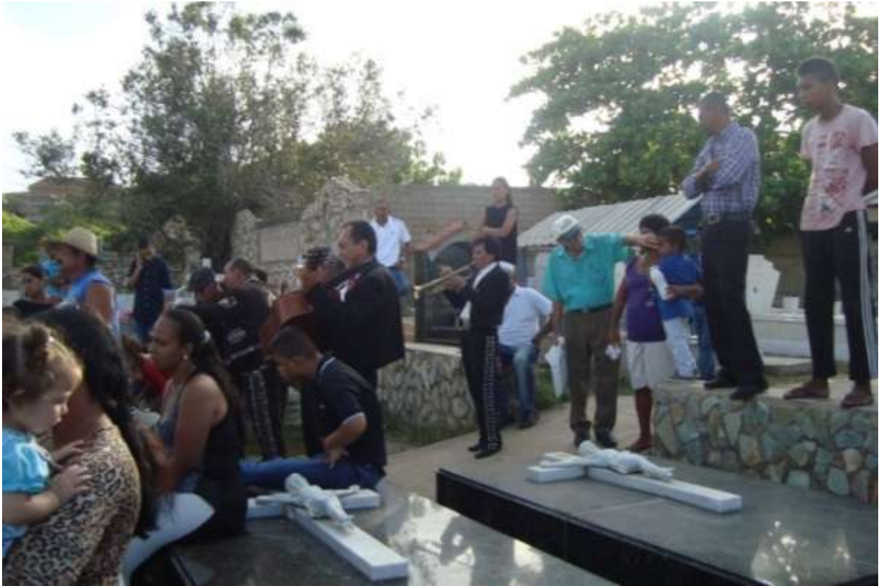
Gráfico 11. Mariachis tocando y cantando en el cementerio.

La tumba es el símbolo donde el difunto descansará en paz hasta llegar al cielo. Encima se coloca, en algunos casos, un crucifijo, al lado de las tumbas se encuentran imágenes y esculturas de ángeles, santos y de la virgen (gráfico 12).