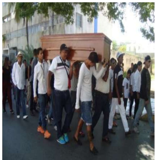
Gráfico 7. Traslado del difunto(a) hasta la iglesia del Cristo del Buen Viaje.