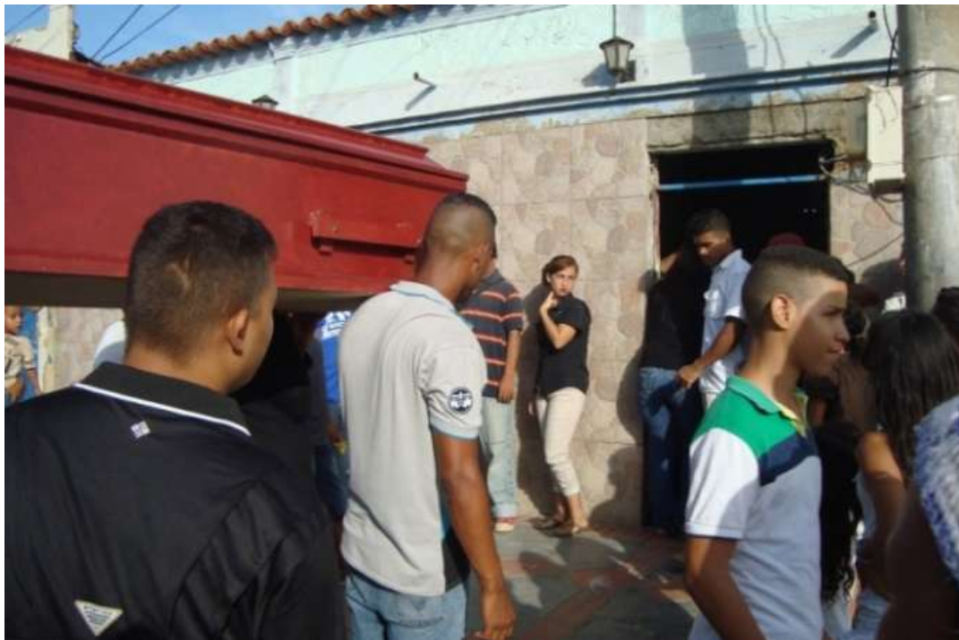
Gráfico 10. Despedida en el frente de la vivienda de la difunta. Agosto, 2016.

En el trayecto, antes de llegar al cementerio, se acostumbra a pararse en el frente de su casa o de familiares para la última despedida (gráfico 10).