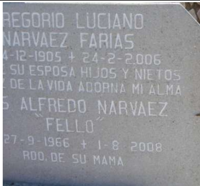
Gráfico 15. Con datos del fallecido y frase de recuerdo.

En algunos casos se escribe poemas o mensajes relacionados con la labor de la persona en vida o frases pidiendo disculpas por lo que pudo haber sido y no fue (gráfico 16). Muchos de estos textos escritos constituyen registros que permiten identificar las RS.