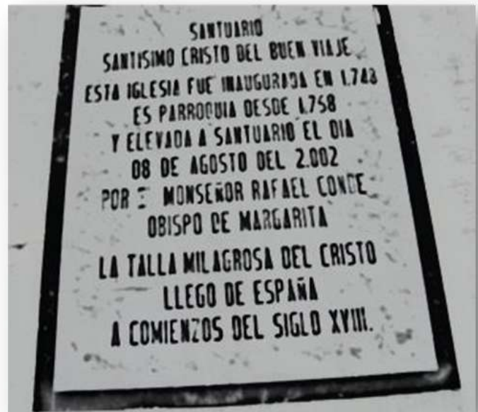
Gráfico 3. Entrada principal del Santuario del Santísimo Cristo del Buen viaje y placa.