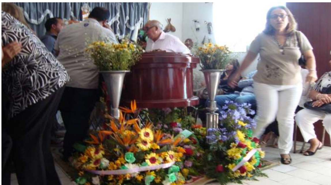
Gráfico 4. Velorio en la sala principal de la vivienda (Noviembre, 2015).

En frente y a los lados de la urna se colocan las coronas o ramos de flores enviadas por familiares, amigos e instituciones relacionadas con el finado. Las flores llevan implícito el proceso de vida. En este sentido, Fernández y Finol (1999), expresan que: “las flores le dan vida a la muerte” y lo temporal de la belleza de la vida y simbolizan la esperanza de una vida futura en el paraíso. Algunas personas consideran que los aromas de las flores constituyen una terapia que canaliza las emociones (gráfico 4).