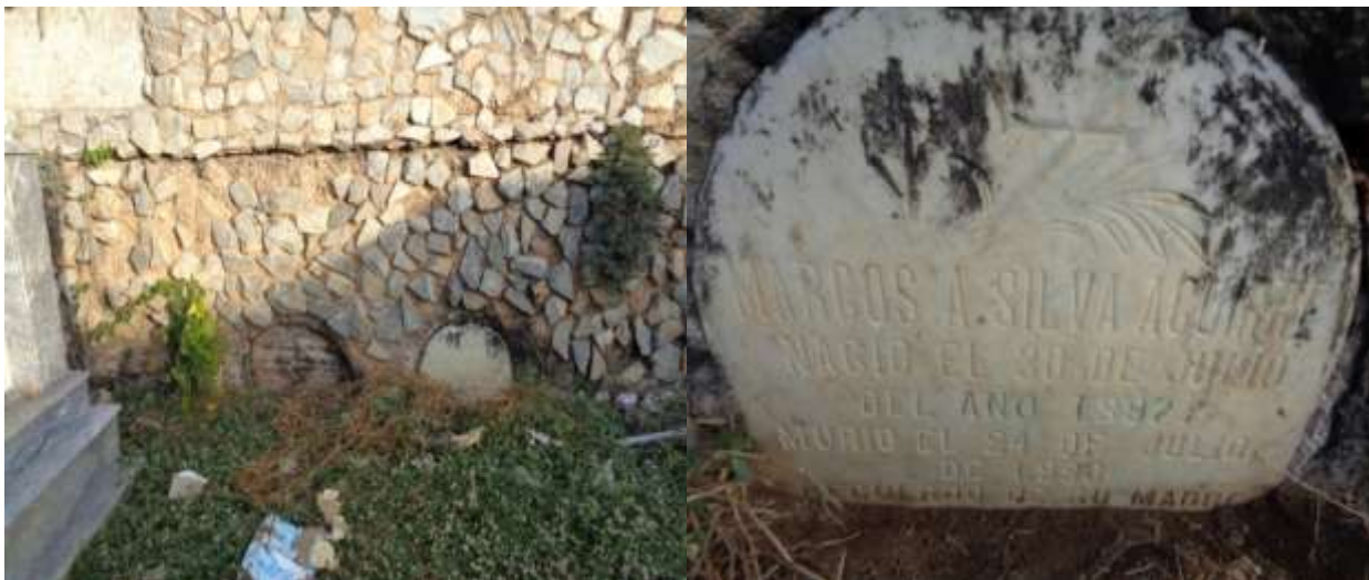
Gráfico 13. Imagen de las bóvedas de cañón que se utilizaban a principio del siglo XX en el Cementerio de Pampatar estado Nueva Esparta, Venezuela.

Anteriormente se enterraban en bóvedas que solo dejaban visible una lápida semi-circular como las que se presentan en el gráfico 13 en la cual se puede ver el nombre del difunto y la fecha de nacimiento y muerte. Esta estructura es importante de conservar porque son evidencias del pasado y una razón de ser de este patrimonio.