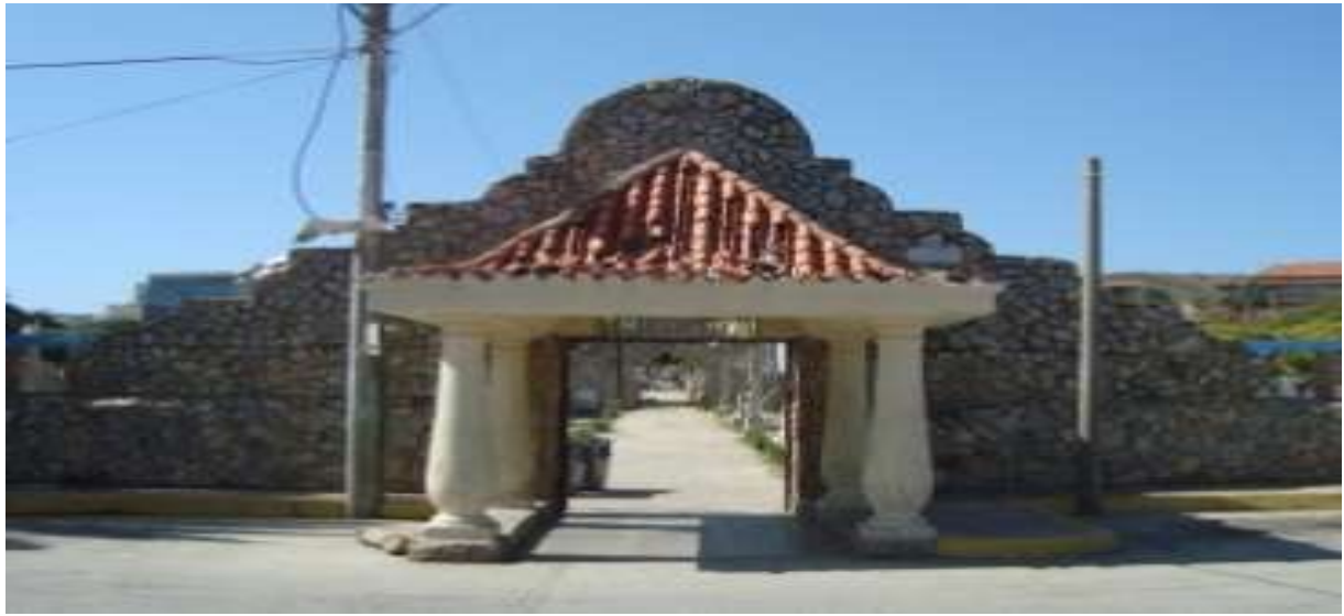
Gráfico 2. Entrada principal del cementerio de Pampatar.

La Iglesia, hoy santuario del Santísimo Cristo del Buen Viaje, está ubicada en la avenida principal Joaquín Maneiro; su construcción data de tiempos de la colonia como se evidencia en la placa anexa (derecha del gráfico 3).