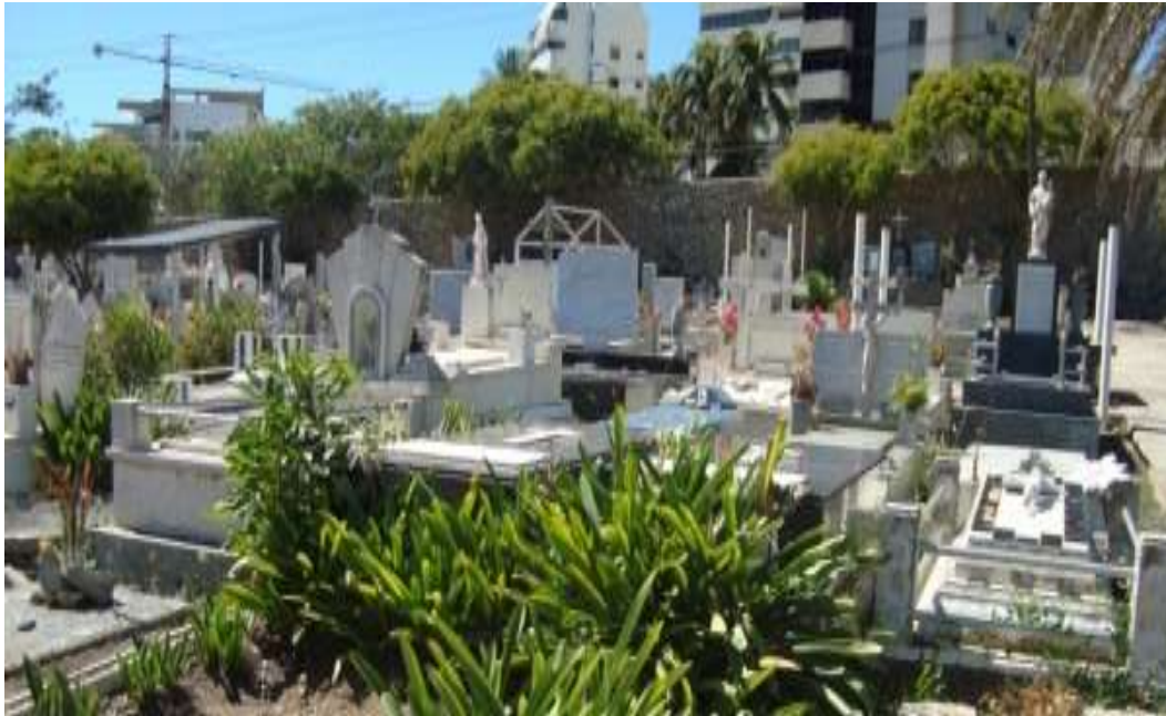
Gráfico 12. Imágenes y esculturas en las tumbas del cementerio

Anteriormente se enterraban en bóvedas que solo dejaban visible una lápida semi-circular como las que se presentan en el gráfico 13 en la cual se puede ver el nombre del difunto y la fecha de nacimiento y muerte. Esta estructura es importante de conservar porque son evidencias del pasado y una razón de ser de este patrimonio.