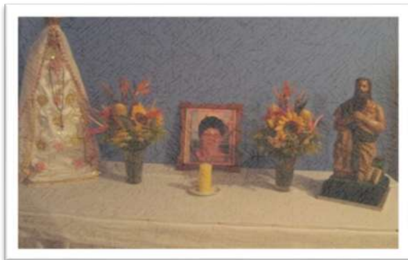
Gráfico 14. Imágenes de la Virgen, de la difunta, y Jesús. Velón en el centro y a los lados dos floreros.

Al mes del fallecimiento se acostumbra a realizar una misa o funeral, después los familiares y amigos acuden a la casa del finado para rezar el rosario. En la casa se coloca una mesa con la foto del difunto(a), operan como sustituciones o es equivalente significativa tributaria del mismo tratamiento que recibe el cuerpo; santos y vírgenes, flores, la luz de un velón para que alumbré el camino al cielo y la vida eterna y también se coloca un vaso de agua o una taza de café (gráfico. 14).