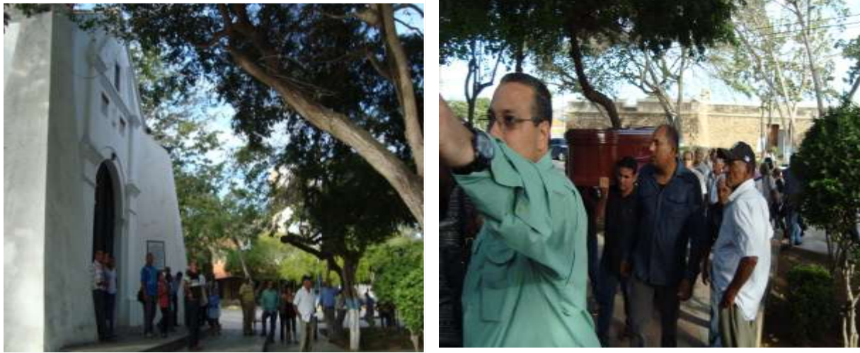
Gráfico 8. Llegada del difunto a la Iglesia del Cristo del Buen Viaje.

Una vez que se llega a la iglesia, otras personas están esperando para dar el pésame, y proceden a entrar en la iglesia (gráfico 8) y se inicia la misa de cuerpo presente.