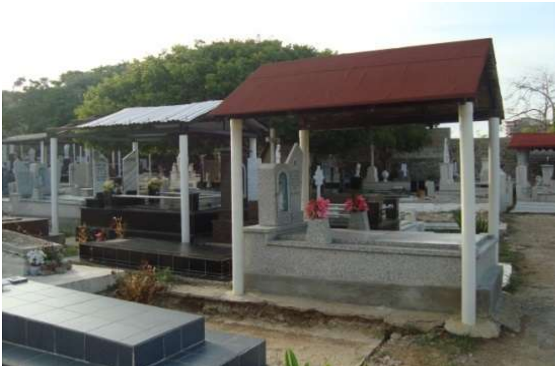
Gráfico 19. Vista de algunas tumbas con techo y columnas similares a la casa.

Esta práctica se realiza los sábados o domingos, el día de los muertos y también la noche de fin del año. Desde temprano los familiares visitan el cementerio para limpiar la tumba, como si fuera la casa (gráfico 19). Se colocan flores y juguetes en el caso de los niños; se reza y se conversa para tratar de realizar un contacto. En la conversación se manifiestan alegrías y preocupaciones para mantener informado al finado del acontecer. Así, se trata de mantenerlo vivo en la memoria de familiares y amigos. En la creencia de un más allá, la idea de que ese ser que murió continúa cuidándolos y protegiéndolos. Constituye esto la forma de sostener el lazo afectivo y de no padecer la separación física del ser.