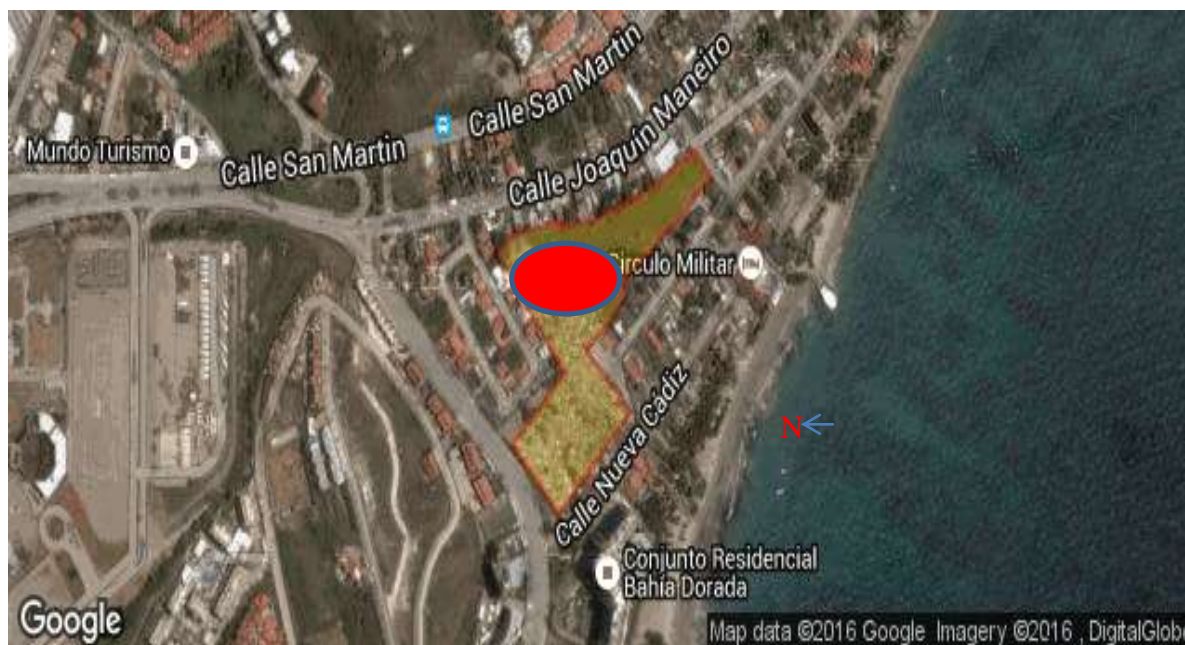
Gráfico 1. Ubicación geográfica del cementerio de Pampatar.

En el gráfico 1 se puede apreciar en el sector oriental del municipio, la ubicación geográfica del cementerio de Pampatar definido por las siguientes coordenadas: 11°00´ y 11°05´ latitud norte y 63°45´ y 63° 50´ longitud oeste.