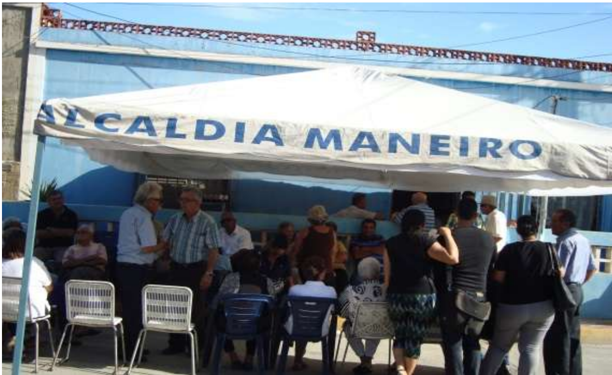
Gráfico 6. Vista de la carpa y asistentes al velorio. Noviembre, 2015.

En la cuadra donde se encuentra la casa del difunto se cierra el paso de vehículos y al frente de la casa se coloca una carpa, suministrada por la Alcaldía del Municipio, o alquilada donde todos comparten: conversan, juegan cartas o dominó, al mismo tiempo que liban (gráfico 6).