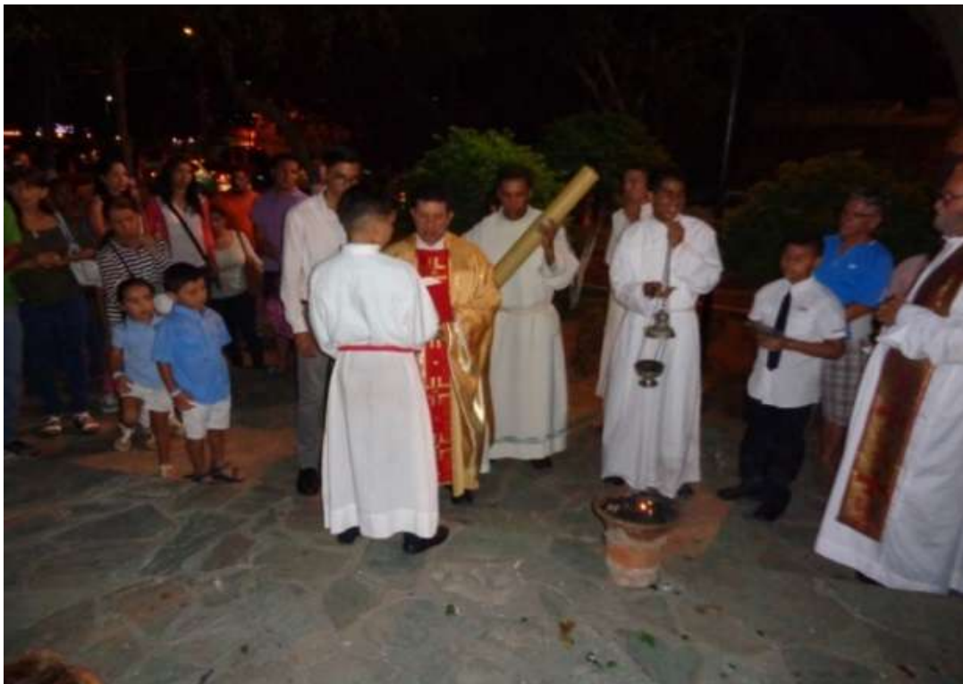
Gráfico 5. Imagen del encendido del cirio en la vigilia de pascua en Pampatar (Marzo, 2018).

Se enciende en todas las misas durante la temporada de Pascua y durante todo el año en bautismos y funerales. En los velorios, las velas iluminan y guían el alma del difunto en su camino hacia la vida eterna.