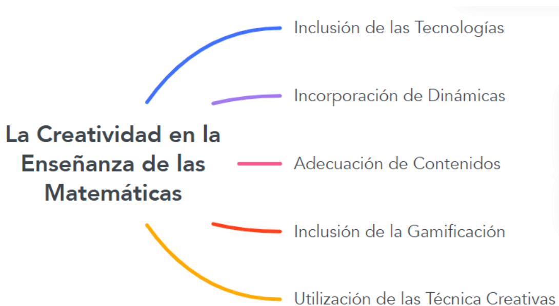
Figura 2. La Creatividad en la Enseñanza de las Matemáticas

Hargreave (2000), quienes indican que el docente de matemática debe romper con viejos esquemas de enseñanza que continúan vigentes y en nada contribuyen con el desarrollo de las competencias numéricas de los estudiantes, es preciso incorporar la creatividad desde una posición pedagógica más activa (p.48). Una forma de actualizar la enseñanza en procura de mejores aprendizajes matemáticos. .