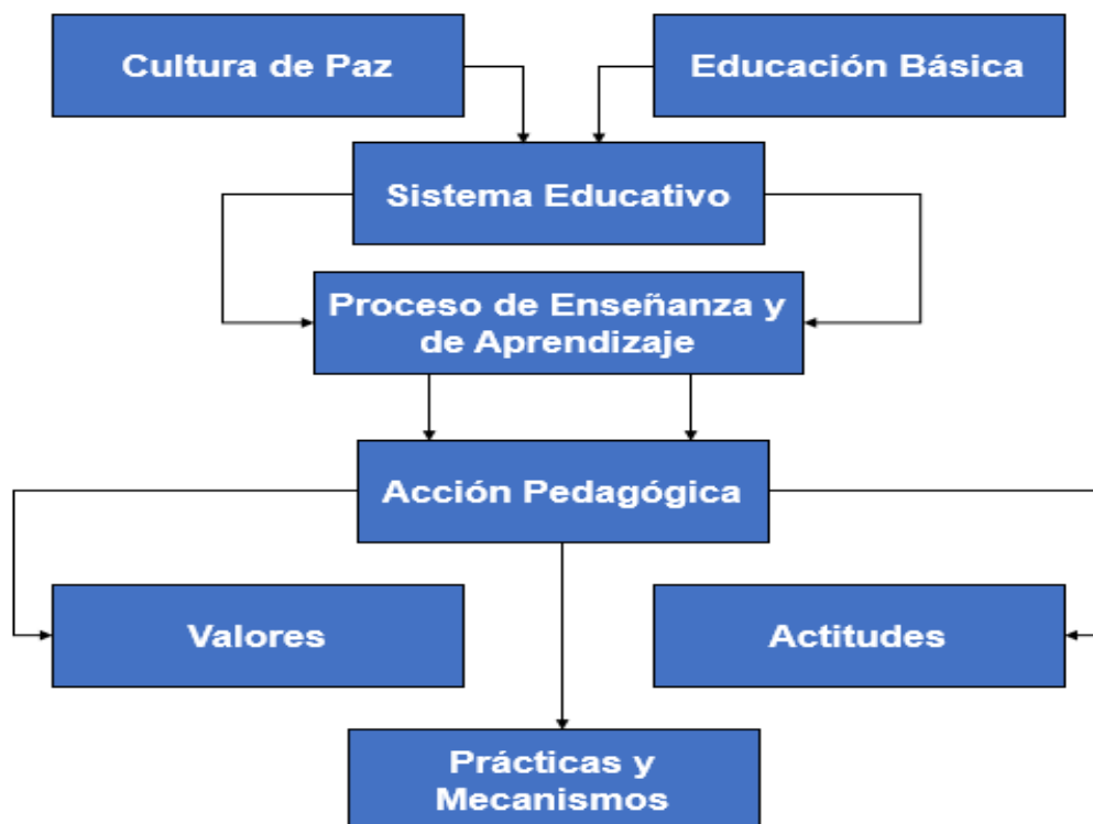
Figura 2. Cultura de Paz y Educación Básica

valores son esenciales para la promoción de la misma, por lo que es pertinente fomentar el respeto, tolerancia, empatía, solidaridad, justicia, igualdad, diálogo, entre otros valores que son de suma importancia, a su vez el uso de normas es indispensable pues se debe de plantear acuerdos de convivencia, que sean establecidos de manera participativa, asimismo, se debe de desarrollar actividades y proyectos que promuevan la paz; como la mediación y la resolución de conflicto, el trabajo en equipo y la celebración de la diversidad, de esta manera se estaría participando en un clima escolar seguro, acogedor y respetuoso donde todos se sientan valorados y tomados en cuenta.