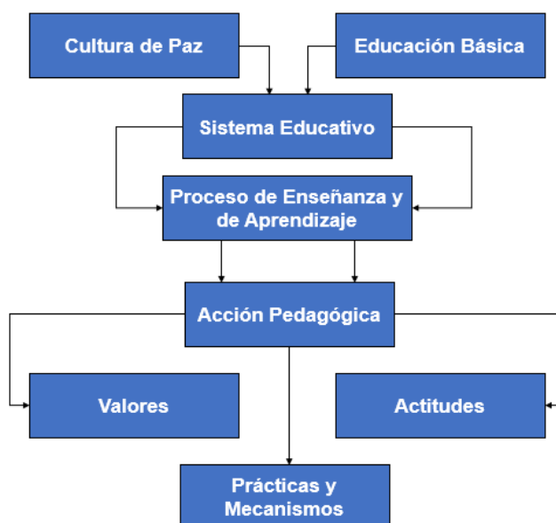
Figura 2. Cultura de Paz y Educación Básica

Por otro lado, se debe destacar diversos elementos claves que conforma una cultura de paz dentro de los entornos educativos. En tal sentido es evidente que los valores son esenciales para la promoción de la misma, por lo que es pertinente fomentar el respeto, tolerancia, empatía, solidaridad, justicia, igualdad, diálogo, entre otros valores que son de suma importancia, a su vez el uso de normas es indispensable pues se debe de plantear acuerdos de convivencia, que sean establecidos de manera participativa, asimismo, se debe de desarrollar actividades y proyectos que promuevan la paz; como la mediación y la resolución de conflicto, el trabajo en equipo y la celebración de la diversidad, de esta manera se estaría participando en un clima escolar seguro, acogedor y respetuoso donde todos se sientan valorados y tomados en cuenta.