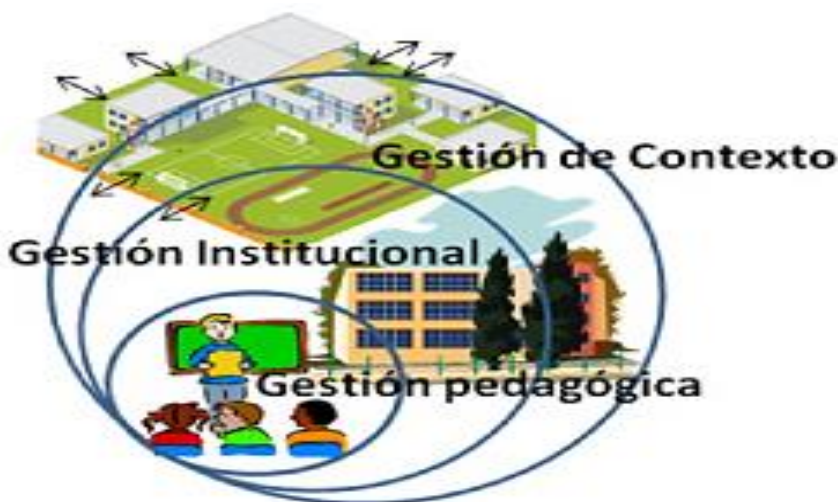
Figura 2 Comunidad de Aprendizaje Inteligente