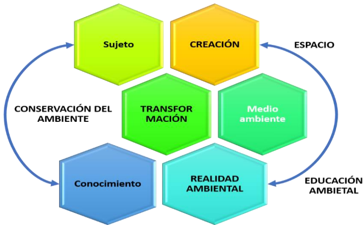
Gráfica 3 Construcción y Transformación del Conocimiento Favorable de la Realidad Ambiental.

A continuación, se presentan en la siguiente gráfica los elementos esenciales constitutivos de la proposición teórica.