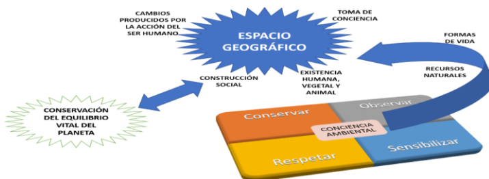
Gráfica 2 Conciencia Ambiental para Concebir el Espacio Geográfico como Construcción Social Educativa.

En consecuencia, desde la escuela se debe abordar la conciencia ambiental para concebir espacio geográfico como construcción social educativa a partir de estrategias de aprendizaje colaborativo que permita al sujeto en contacto con su ambiente tomar conciencia de ese entorno y valorarlo al mismo tiempo que genera acciones que le permiten procesar la información emergente en esa interacción sujeto – medio para aprender con significados con un énfasis en el aprender permanente o para la vida. Todo sujeto que tenga autoconsciencia sobre la importancia de valorar e interactuar con el ambiente será capaz de construir una identidad ambiental favorable a la comunidad y al propio sujeto.