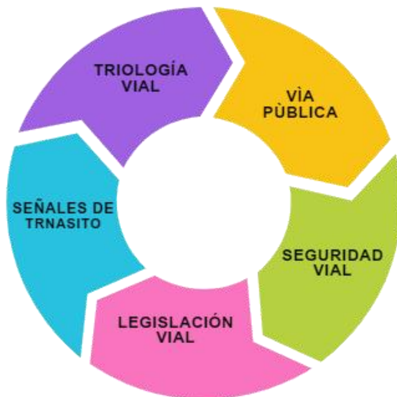
Figura 1. Elementos claves de la educación vial.