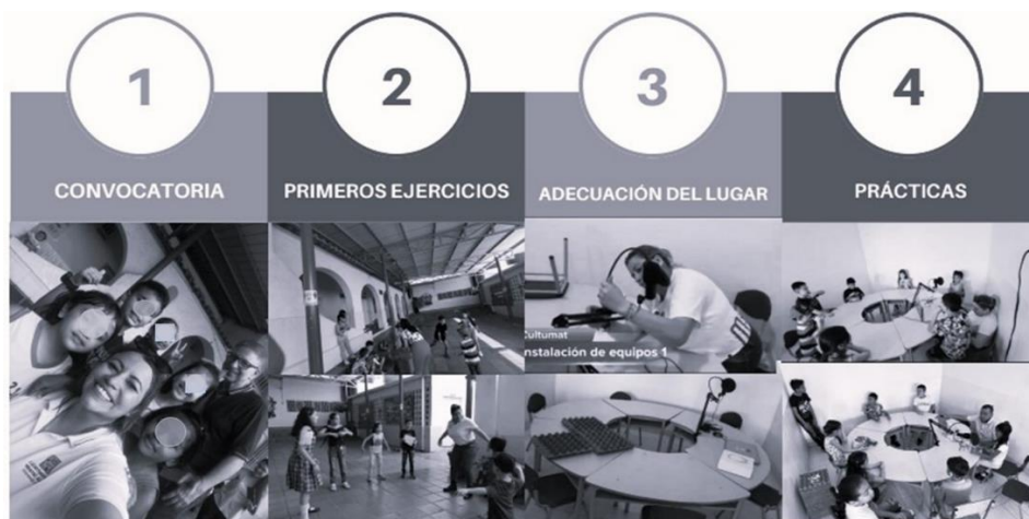
Imagen 1. Fotografías del (1) día de la convocatoria, (2) primeros ejercicios de voz y articulación, (3) adecuación a lugar, y (4) prácticas desarrolladas.

Parte de las discusiones que se generaron a partir de los resultados se acentuaron también en la apropiación del proceso creativo de los podcasts y su impacto positivo en el saber y saber hacer de los estudiantes de la institución San José. En cuanto a la participación en la producción se vieron beneficiados directamente de los ejercicios dispuestos en este proceso mejorando la comprensión auditiva, el lenguaje, la redacción, la respiración, expresión y tono de voz. En este aspecto, se pudo observar que las integrantes de género femenino obtuvieron mayor valoración en cuanto a la fluidez verbal, la improvisación y creatividad, que el grupo de estudiantes de género masculino. Solano et al. (2010) lo explica desde la utilidad de la multimedia como facilitadora en los procesos de enseñanza aprendizaje porque permite elaborar contenidos adaptados a la realidad educativa. Otra perspectiva se afianza en el descubrimiento de temas de interés para las nuevas generaciones, proyectando una mayor madurez cognitiva en los participantes (Imagen 1).