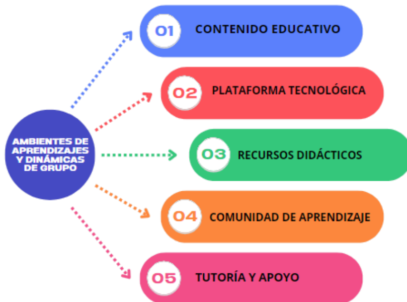
Figura 2. Ambientes de aprendizaje e integración con las dinámicas de grupo

Es importante tener en cuenta que los ambientes de aprendizaje son esenciales para que los estudiantes se adapten a situaciones de aprendizaje de gran impacto; lo cual conlleva a establecer las bases de lo que es definir cada uno de los elementos que intervienen en el proceso de enseñanza y aprendizaje desde lo que es los modos pedagógicos y en él confluyen las acciones y buenas prácticas que dejan ver el acervo programático de cada una de las asignaturas, es por ellos que se canalizan actividades que buscan conjugar lo que es las dinámicas grupales y los ambientes de aprendizaje; aspectos que se logran ver en lo siguiente: