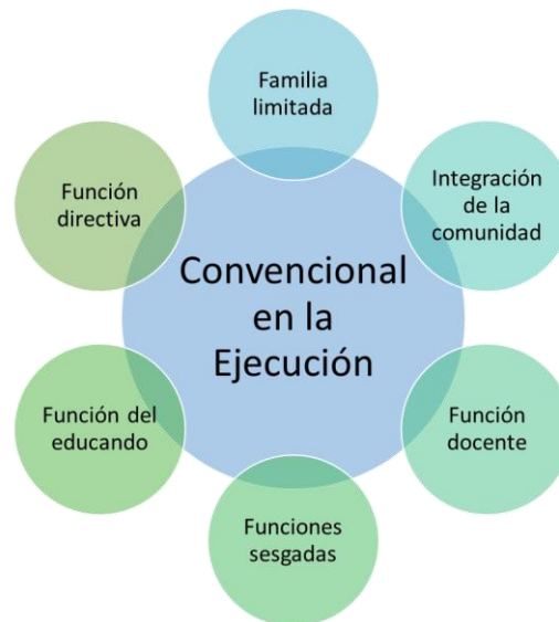
Figura 2. Construcción teórica hacia la identificación de una escuela como entidad convencional en su ejecución

Tradicionalidad en la Escuela de Hoy. De acuerdo con el protocolo metodológico aplicado para comprender el discurso de los informantes, hay que consolidar ahora un proceso de interpretación de los resultados obtenidos, pues esto terminará reflejando el significado y práctica de una escuela que, tiene como cometido que sea vista culturalmente de manera tradicional, pues los beneficios que genera en la actualidad no distan mucho de lo acontecido antes y, por lo tanto, marca la diferencia de una formación efectiva u obstaculizada.