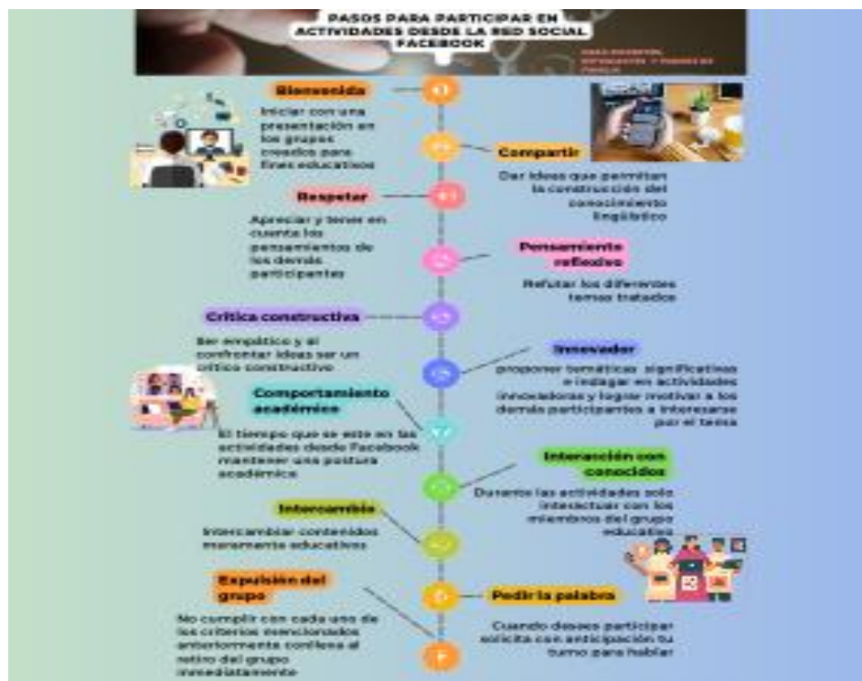
Gráfico 2. Pasos para participar en actividades desde la red social Facebook

Es así como el manual para el uso académico de Facebook se convierte en el conjunto de normas y/o comportamientos que deben tener los estudiantes, docentes y padres de familia para participar, interactuar y construir conocimiento lingüístico desde las diferentes actividades que se planteen desde Facebook, prevaleciendo siempre el respeto a la libertad de expresión y pensamiento, como también la promoción de valores como el respeto y la tolerancia. De esta manera, se describen los siguientes pasos generales para la participación en las diferentes actividades que se realicen desde Facebook (ver Gráfico 2).