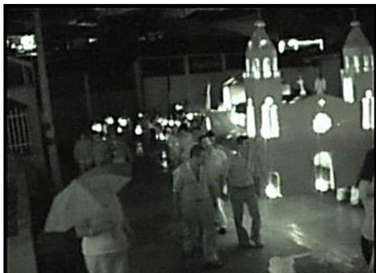
Imagen 2. Concurso de faroles

Generalmente, se quema pólvora, se hacen juegos pirotécnicos, se cantan villancicos y se prenden luces en las calles del municipio y los habitantes aprovechan el momento para reunirse en familia, con los vecinos y amigos. Tradicionalmente, se recolecta dinero para comprar las velas y alumbrar la gruta de la Virgen de Lourdes ubicada en el camino al cementerio, desde donde se observa el alumbrado de todo el municipio.