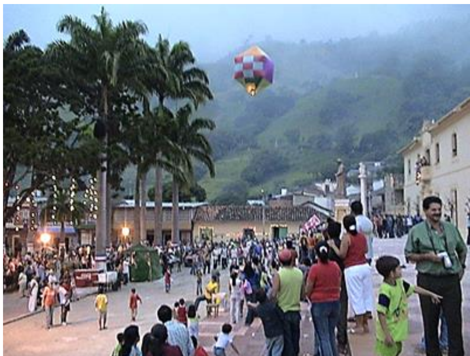
Imagen 6. Elevación de globos-parque principal

El 31 de diciembre retornaban las promociones de bachilleres, familias y amigos se reunían en la plaza o en el atrio de la iglesia para la elevación de globos realizados con pliegos de papel seda, algunos casos llegados a 300 pliegos, para ser elevados con el aire caliente que generaba el fuego de la antorcha ubicada en la parte inferior. Cada promoción gozaba de este reencuentro, de tomarse su aguardiente, reír, echarse; agua, harina, huevos, y compartir un rato agradable. Se empezaron a lanzar por promociones de cada año, entonces los globos tenía el nombre y el número de la promoción, y se volvió un punto de encuentro de compañeros de colegio, uniendo muchísimo a la gente, había Gramaloteros que vivían en Bogotá y venían a esta tradición.