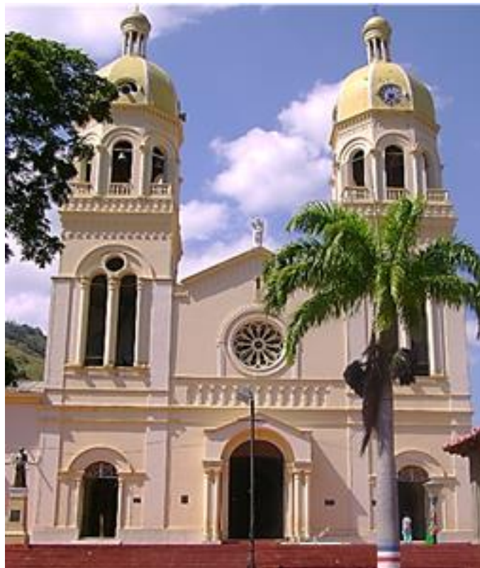
Imagen 4. Iglesia San Rafael de Gramalote

La alegría de las fiestas decembrinas alcanzaba su punto álgido con la finalización de las comparsas previo a la misa de noche buena. El ambiente festivo incluía diversas actividades y juegos entre los habitantes del municipio que luego se congregaban para la misa de gallo, tal como explicaban los informantes en la entrevista.