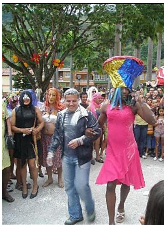
Imagen 5. Disfrazados - día de los locos

Agua, harina y olores desagradables, eran las herramientas para lanzar a los curiosos que se asomaban por los balcones y ventanas cuando paseaban por el sector, además de las guerras de agua que se provocaban entre vecinos. Particularmente cuando un hombre es capturado, se realiza el sacrificio que consiste en quitarle la ropa en su totalidad y exhibirlo en una vuelta al parque principal.