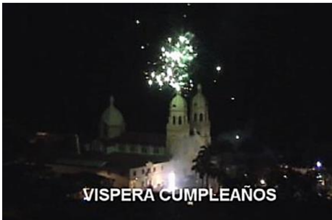
Imagen 1. Cumpleaños 1857-2007 del municipio de Gramalote, fuegos artificiales