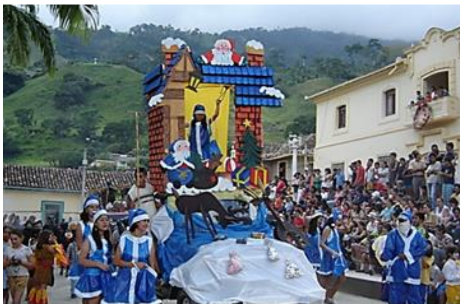
Imagen 3. Representación Comparsa

Repique de Campanas. El repique de las campanas a las 12:00 del mediodía como un signo de vísperas de la novena del día siguiente; las campanas que marcaban la alegría, el son del municipio de Gramalote, las encargadas de anunciar las festividades navideñas.